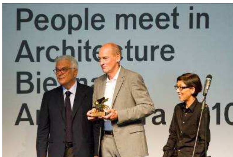
Le 28 août 2010, lors de la 12ème Biennale d'architecture de Venise, Rem Koolhaas a reçu, pour sa carrière, le Lion d'Or 2010

Après un chantier de 24 mois, représentant un investissement de près de 51 millions d'euros TTC, l'ouverture est prévue pour le printemps 2015.