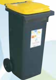
Bac jaune (pour l'habitat collectif)