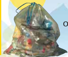
Sac jaune (pour l'habitat pavillonnaire)

Les gros cartons d'emballages peuvent être présentés pliés ou ficelés à côté du sac ou du bac.