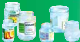
Pots et bocaux en verre