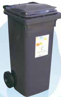
Bac gris Pour les ripeurs, pensez à garder votre bac propre.

*Un certain nombre de déchets (notamment les épluchures et les restes de repas...), peuvent être compostés (voir page 8 )