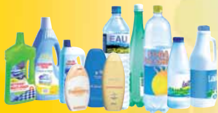
Bouteilles et flacons en plastique, y compris les bouteilles d'huile végétale