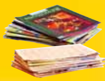
Papiers, journaux-magazines (sans film plastique)