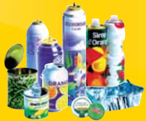
Bouteilles et boîtes métalliques, couvercles de pots